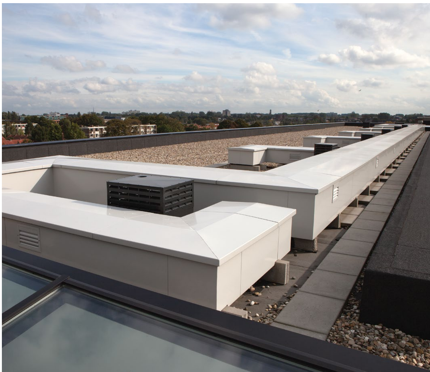
Aluminium demontabel maatwerk om nutstracés op het dak te beschermen

functionaliteit. Roval combineert deze twee uitgangspunten in een uitgebreide, maar afgewogen productrange. Voor inspirerende projectvoorbeelden verwijzen we u graag naar www.roval.be .