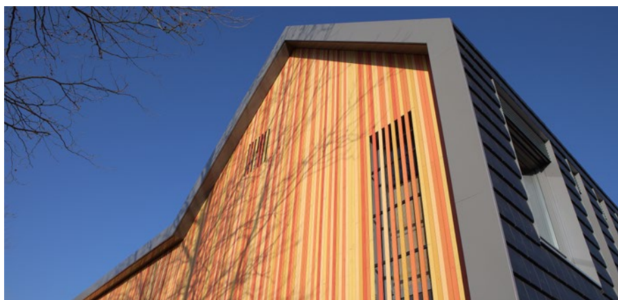
Aluminium muurafdekkappen op uniek klanksysteem voor schroefloze montage

De aluminium muurafdekkappen van Roval Aluminium behoren in velerlei opzicht tot de allerbeste in de markt. De toepassingsgebieden zijn divers, want alle types muurafdekkappen zijn te vinden op onder meer borstweringen op balkons of loggia's en op daken als randafwerking in zowel de woningbouw als utiliteitsbouw. Wie denkt dat deze in eigen huis ontwikkelde kappen, die perfect te combineren zijn met de aluminium balustersystemen van Roval, alleen gereserveerd worden voor buitentoepassingen, komt bedrogen uit. Want de architect heeft de aluminium muurafdekkap van Roval ook ontdekt voor toepassing binnen het gebouw. Tot het assortiment muurafdekkappen van Roval behoren verschillende vormen met waterkering of bijvoorbeeld een