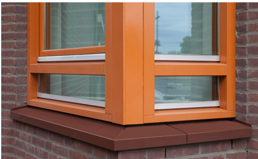
Kleurrijke aluminium raamdorpel Stadionkwartier, Eindhoven

De aluminium raamdorpels van Roval kunnen worden geleverd met bevestigings(slob)gaten, (gelaste) kopschotten en verstekhoeken, antitreunisolatie en beschermfolie en met tien jaar garantie! De raamdorpels kunnen worden uitgevoerd in brute, geanodiseerde of gemoffelde uitvoering in vrijwel alle ralkleuren.