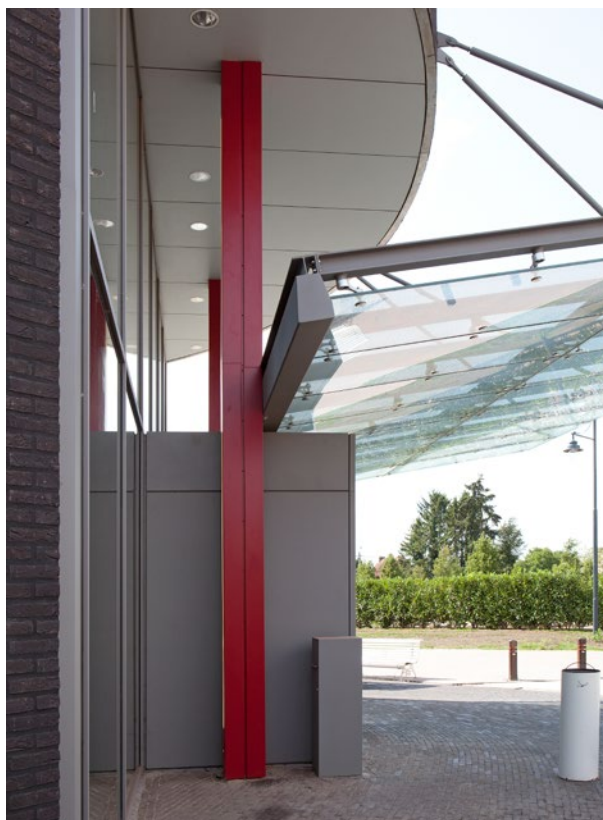
Aluminium kolombekleding met ledverlichting. Alle ralkleuren zijn mogelijk.