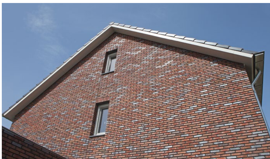
Aluminium goot- en overstekbekleding, functioneel en duurzaam

Een slimme doorontwikkeling van kolombekleding is de goot- en overstekbekleding, die Roval inmiddels in verschillende projecten met succes heeft toegepast. Doordat boeiboord- en kolombekledingen vrijwel altijd maatwerk zijn, worden deze toepassingen niet alleen in nieuwbouwprojecten gerealiseerd, maar ook in renovatie- en herbestemmingsprojecten, die een functionele duurzaamheidslag moeten maken.