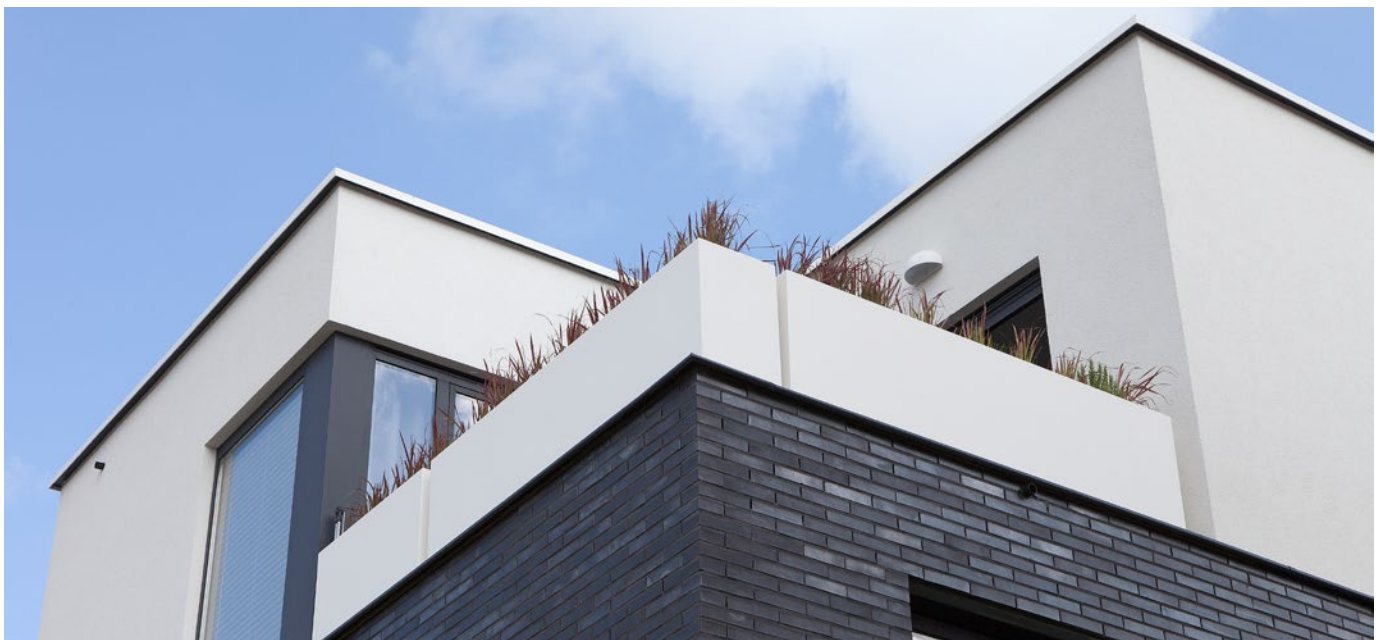
Aluminium dakranden accentueren overgang van gevel naar dak

geotrooieerde enkelvoudige dakranden, die voorzien zijn van een speciaal ontwikkelde EPDM-afdichtingsband. Deze dakrandafwerking wordt pas ná de dakbedekking aangebracht. De dakranden van Roval, waar tien jaar garantie op zit, kunnen worden geleverd, inclusief bevestigings(slob) gaten, binnenhoeken en buitenhoeken en verbindingsplaatjes. Bovendien kunnen de meeste dakranden van Roval Aluminium ook in gewalste uitvoering worden uitgevoerd. Voor alle dakranden geldt dat ze in brute, geanodiseerde of gemoffelde uitvoering in vrijwel alle ralkleuren leverbaar zijn.