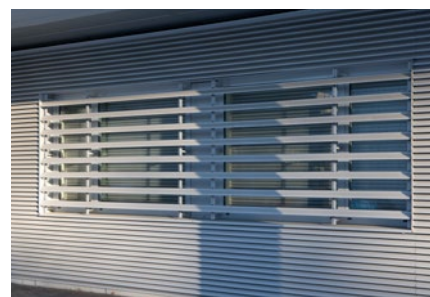
Aluminium ventilatieroosters voor natuurlijke ventilatie

Met de variabele mogelijkheden van de aluminium muurroosters, die onder te verdelen zijn in RovalGrille, RovalFrame