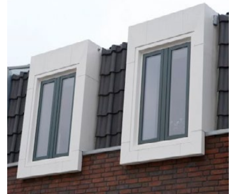
Aluminium kozijnomkadering om vensters te accentueren

renovatie en bij stucwerk, metselwerk of hout. De dagkanten zorgen niet alleen voor een fraaie uitstraling, maar bieden ook bescherming. De Roval dagkanten zijn leverbaar in diverse modellen en afwijkende maten; speciale vormgevingen behoren eveneens tot de mogelijkheden. De foto's laten zien welke uiteenlopende maatwerkmogelijkheden er zijn in vorm en kleur. Regelmatig worden ook aluminium kozijnomkaderingen toegepast om bijvoorbeeld de vensters te accentueren of een gevellijn aan te brengen.