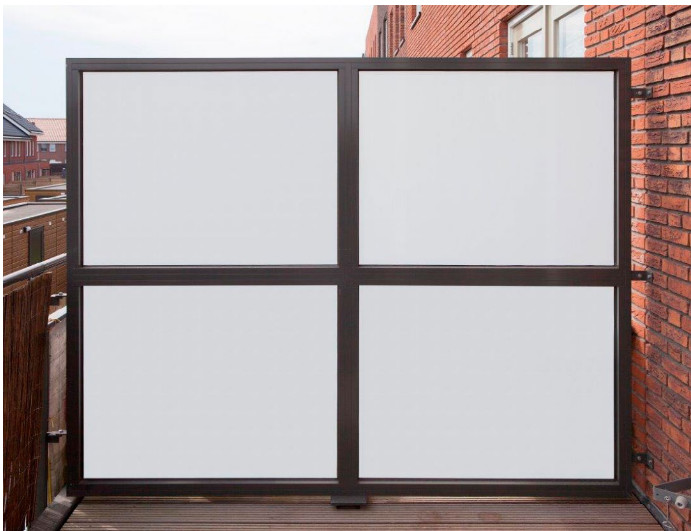
Aluminium privacyschermen als afscheiding

van duurzaam aluminium. Deze privacyschermen zijn desgewenst leverbaar in blank geanodiseerde of diverse ralkleuren. Er zijn vele ontwerpvrijheden in verschillende glas- of kunststof/HPL-uitvoeringen en rechte of afgeschuinde hoeken. Ook hier gelden de inventieve maatwerkmogelijkheden van Roval.