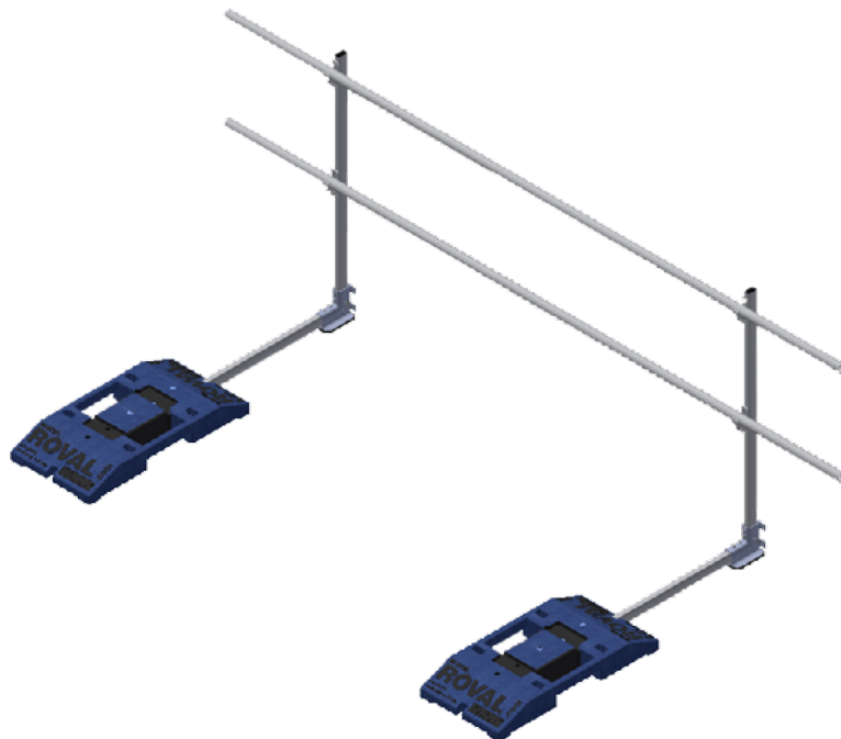
De Roval-RoofGuard® een lichtgewicht en modulaire aluminium dakrandbeveiliging

lichtgewicht aluminium, dat de montage vergemakkelijkt. Ook de robuuste en sterke voet, waarin de staanders worden bevestigd is van aluminium. De Roval-RoofGuard® ontleent zijn stabiliteit en stevigheid aan de constructie en aan de gerecyclede kunststof contragewichten. Een extra functionaliteit is dat het Roval-RoofGuard® dakrandbeveiligingssysteem uit te rusten is met ledverlichting, die het betreden van het dak in het donker veiliger maakt. Extra pluspunt van de Roval-RoofGuard® is dat het aluminium onderhoudsarm is.