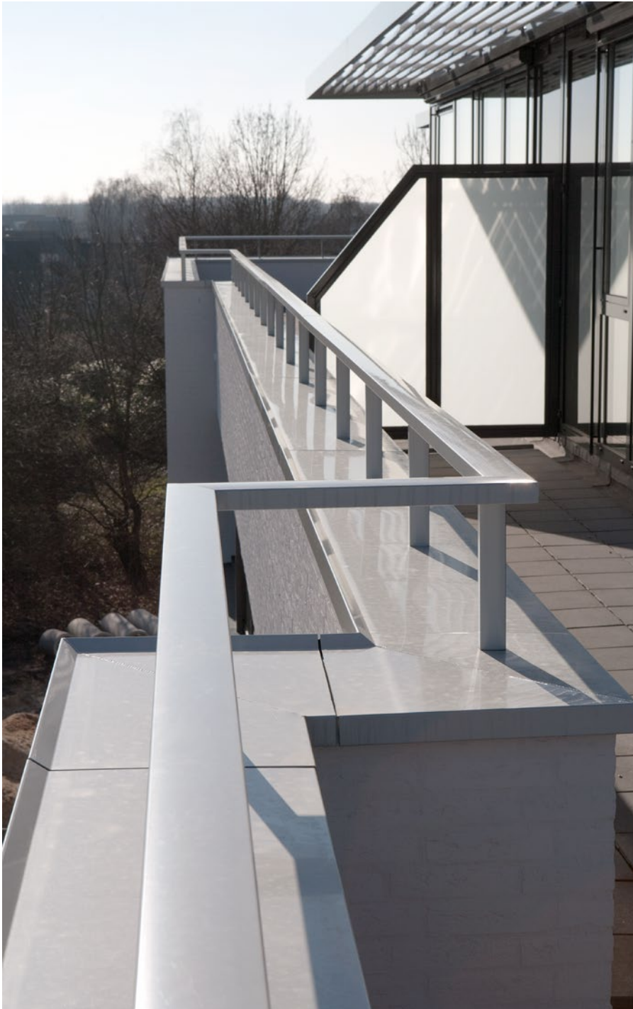
Aluminium muurafdekkap met aluminium balusters op borstwering

In één adem met de aluminium muurafdekkappen kunnen de aluminium balustersystemen van Roval worden genoemd. De balusters kunnen los gemonteerd worden of blind geïntegreerd op een aluminium muurafdekker. Deze blinde bevestiging vergroot de esthetische beleving en heeft daarnaast ook een praktische functie. Doordat de baluster niet op de muurafdekkap hoeft te worden bevestigd, behoudt de kap zijn stevigheid en dat komt de levensduur ten goede. Daarnaast kan de baluster ook worden toegepast als afwerking op transparante panelen, waardoor er een vrij uitzicht ontstaat.