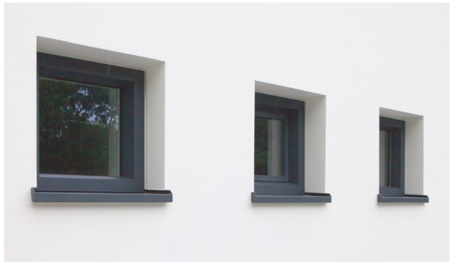
Aluminium raamdorpels, particuliere woning, Breda

Dankzij de speciale kopschotten kunnen de aluminium raamdorpels van Roval ook worden toegepast in